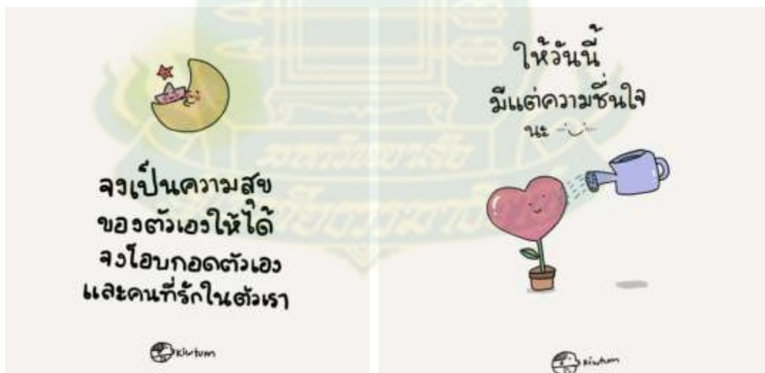
ภาพที่ 4.1 ตัวอย่างภาพและคำคมเสริมกำลังใจแก่ผู้อยู่ในสถานการณ์กักกันทางอินเทอร์เน็ต