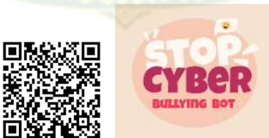
ภาพที่ 4.2 ภาพ QR Code ที่สแกนเข้าบอท และสัญลักษณ์ของไลน์แชตบอต StopBullyBot

ชุดฝึกอบรมที่มีการปฏิสัมพันธ์ผ่านแชตบอตฯ ที่พัฒนาขึ้นใช้โปรแกรมไลน์เป็นเครื่องมือในการดำเนินการ มีสัญลักษณ์ของไลน์แชตบอตที่ชื่อว่า StopBullyBot ซึ่งผู้ใช้งานสามารถเข้าสู่ไลน์บอทได้โดยใช้สมาร์โฟน add Line OA : @219bqbqr เป็นเพื่อน หรือ เข้าผ่านลิงก์ https://lin.ee/OjydSVJ หรือ Scan QR Code เพิ่มเพื่อน ก็จะสามารถเข้าสู่ไลน์แชตบอตที่มีรูปสัญลักษณ์ ดังภาพต่อไปนี้