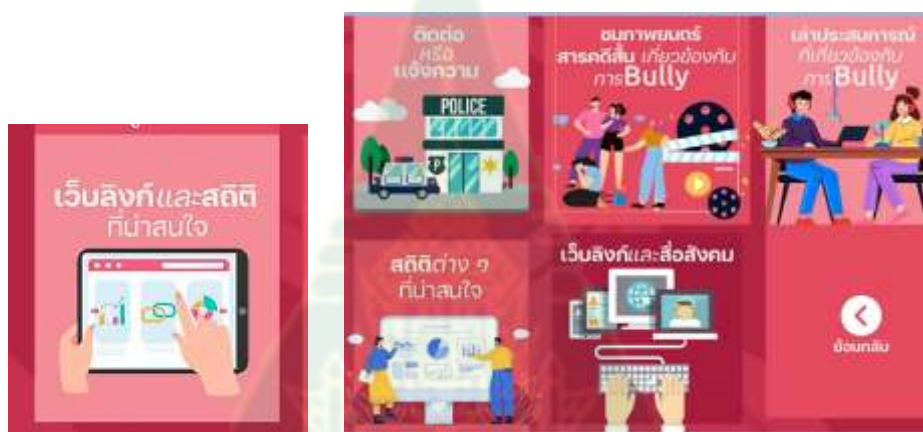
ภาพที่ 4.10 เมนู “เว็บลิงก์และสถิติที่น่าสนใจ”

จากภาพที่ 4.10 แสดงเมนูของแพลตฟอร์ม เว็บลิงก์และสถิติที่น่าสนใจ มีเมนูให้เลือกเข้าไปเรียนรู้ 5 รายการ ได้แก่ 1) การติดต่อหรือแจ้งความ 2) ชมภาพยนตร์ สารคดีสั้นเกี่ยวกับการ Bully 3) สถิติต่างๆ ที่น่าสนใจ 4) เว็บลิงก์และสื่อสังคม และ เมนูที่น่าสนใจ คือ 5) เล่าประสบการณ์ที่เกี่ยวข้องกับ Bully