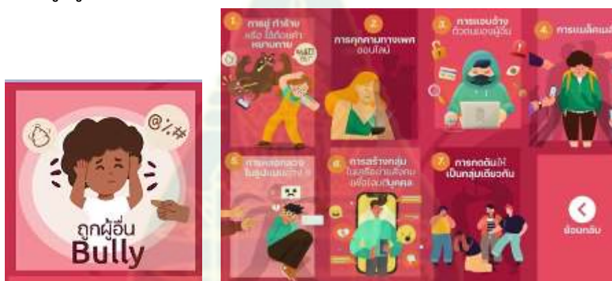
ภาพที่ 4.6 เมนู “ถูกผู้อื่น Bully ”

จากภาพที่ 4.6 แสดงเมนูของแชตบอต ในประเด็นหลัก เรื่อง ถูกผู้อื่น Bully ซึ่งเป็นการสร้างความตระหนักรู้เกี่ยวกับการเคยเป็นผู้กลั่นแกล้ง มีเมนูให้เลือก 7 รายการ ได้แก่ 1) การขู่ทำร้ายหรือใช้ถ้อยคำหยาบคาย 2) การคุกคามทางเพศออนไลน์ 3) การแอบอ้างตัวตนของผู้อื่น 4) การแบล็คเมล์ 5) การหลอกลวงในรูปแบบต่าง ๆ 6) การสร้างกลุ่มในเครือข่ายสังคมเพื่อโจมตีบุคคล และ 7) การกดดันให้เป็นกลุ่มเดียวกัน และเมื่อมีการโต้ตอบกับบอต บอตจะแนะนำวิธีการรับมือและปรับตัวต่อการถูกกลั่นแกล้งด้วยการชมวิถีทัศนกรณีสี่ตัวอย่าง เพื่อให้ผู้ใช้สามารถรับมือต่อเหตุการณ์ที่เกิดขึ้นได้ โดยระบบจะสุ่มวิดีโอที่สอดคล้องกับความต้องการมาให้ชม ดังภาพที่ 4.7