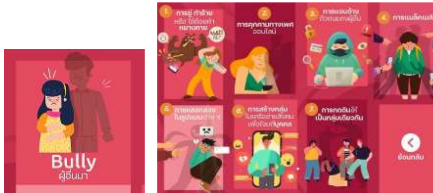
ภาพที่ 4.4 เมนู “Bully ผู้อื่นมา”

จากภาพที่ 4.4 แสดงเมนูของแชทบอท ในประเด็นหลัก เรื่อง Bully ผู้อื่นมา ซึ่งเป็นการสร้างความตระหนักรู้เกี่ยวกับการเคยเป็นผู้กลั่นแกล้งผู้อื่นในโซเชียล มีเมนูให้เลือก 7 รายการ ได้แก่ 1) การขู่ทำร้ายหรือใช้ถ้อยคำหยาบคาย 2) การคุกคามทางเพศออนไลน์ 3) การแอบอ้างตัวตนของผู้อื่น 4) การแบล็กเมล์ 5) การหลอกลวงในรูปแบบต่าง ๆ 6) การสร้างกลุ่มในเครือข่ายสังคมเพื่อโจมตีบุคคล และ 7) การกดดันให้เป็นกลุ่มเดียวกัน และเมื่อมีการโต้ตอบกับบอท บอทจะแนะนำวิดีโอทัศนกรณิตัวอย่างๆ ให้ชมเพื่อให้ผู้ใช้เกิดความตระหนักรู้ในการลดพฤติกรรมกลั่นแกล้งผู้อื่น โดยระบบจะสุ่มวิดีโอที่สอดคล้องกับความต้องการมาให้ชม ดังภาพที่ 4.5