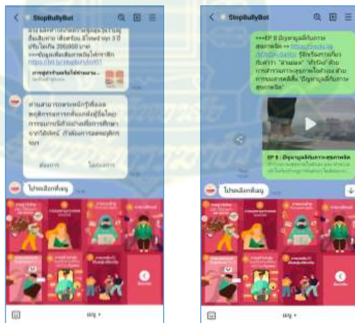
ภาพที่ 4.5 ภาพการโต้ตอบระหว่างบอทกับผู้ใช้งาน ในสถานะ “Bully ผู้อื่นมา”

จากภาพที่ 4.4 แสดงเมนูของแชทบอท ในประเด็นหลัก เรื่อง Bully ผู้อื่นมา ซึ่งเป็นการสร้างความตระหนักรู้เกี่ยวกับการเคยเป็นผู้กลั่นแกล้งผู้อื่นในโซเชียล มีเมนูให้เลือก 7 รายการ ได้แก่ 1) การขู่ทำร้ายหรือใช้ถ้อยคำหยาบคาย 2) การคุกคามทางเพศออนไลน์ 3) การแอบอ้างตัวตนของผู้อื่น 4) การแบล็กเมล์ 5) การหลอกลวงในรูปแบบต่าง ๆ 6) การสร้างกลุ่มในเครือข่ายสังคมเพื่อโจมตีบุคคล และ 7) การกดดันให้เป็นกลุ่มเดียวกัน และเมื่อมีการโต้ตอบกับบอท บอทจะแนะนำวิดีโอทัศนกรณิตัวอย่างๆ ให้ชมเพื่อให้ผู้ใช้เกิดความตระหนักรู้ในการลดพฤติกรรมกลั่นแกล้งผู้อื่น โดยระบบจะสุ่มวิดีโอที่สอดคล้องกับความต้องการมาให้ชม ดังภาพที่ 4.5