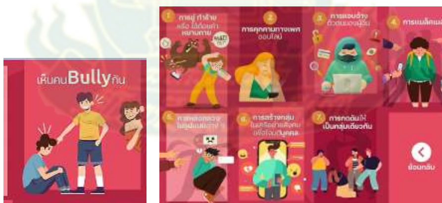
ภาพที่ 4.8 เมนู “เห็นคน Bully กัน”

จากภาพที่ 4.8 แสดงเมนูของแชตบอต ในประเด็นหลัก เรื่อง เห็นคน Bully กัน ซึ่งเป็นการสร้างความตระหนักรู้เกี่ยวกับการเคยเห็นผู้คนกลั่นแกล้งกันในไซเบอร์ มีเมนูให้เลือก 7 รายการ ได้แก่ 1) การขู่ทำร้ายหรือใช้ถ้อยคำหยาบคาย 2) การคุกคามทางเพศออนไลน์ 3) การแอบอ้างตัวตนของผู้อื่น