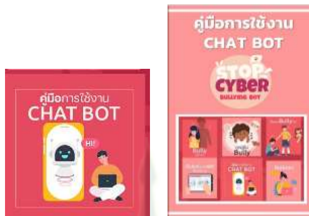
ภาพที่ 4.11 เมนู “คู่มือการใช้งาน CHAT BOT”

จากภาพที่ 4.11 แสดงเมนูของแชทบอต คู่มือการใช้งาน CHAT BOT เมื่อคลิกเข้าไปจะพบข้อความให้คลิกเข้าสู่ลิงก์ คู่มือการใช้งาน Chat Bot: https://anyflip.com/ljv/zjzc/ ซึ่งจะมีสื่อภาพและข้อความอธิบายพร้อมยกตัวอย่างการใช้งานแชทบอต