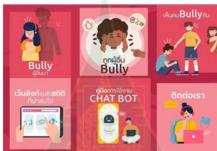
ภาพที่ 4.3 หน้าจอหลักไลน์แชตบอต StopBullyBot

เมื่อผู้ใช้งานคลิกเข้าไปที่ไลน์แชตบอต StopBullyBot หน้าจอหลักของแชตบอตจะปรากฏเมนูให้คลิกเข้าไปปฏิสัมพันธ์เรียนรู้เกี่ยวกับการกลั่นแกล้งทางไซเบอร์ ในดังภาพต่อไปนี้