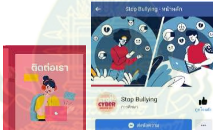
ภาพที่ 4.12 เมนู “ติดต่อเรา”

จากภาพที่ 4.12 แสดงเมนูของแชทบอต ติดต่อเรา เมื่อคลิกเข้าไปจะพบข้อความให้คลิกเข้าสู่ลิงก์ติดต่อเราได้ทาง Messenger ใน Facebook Page: https://www.facebook.com/StopBullyingBot ซึ่งจะนำไปสู่เพจบุ๊ก ที่มีพื้นที่สำหรับสมาชิกทุกคนสามารถสื่อสาร แลกเปลี่ยนเรียนรู้ ข้อมูล ข่าวสารสำคัญ เกี่ยวกับการกลั่นแกล้งทางไซเบอร์ได้