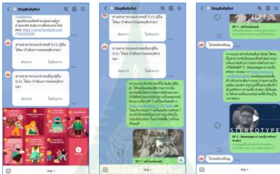
ภาพที่ 4.9 ภาพการโต้ตอบระหว่างบอตกับผู้ใช้งาน ในสถานะ “เห็นคน Bully กัน”

4) การแบล็คเมล์ 5) การหลอกลวงในรูปแบบต่าง ๆ 6) การสร้างกลุ่มในเครือข่ายสังคมเพื่อโจมตีบุคคล และ 7) การกดดันให้เป็นกลุ่มเดียวกัน และเมื่อมีการโต้ตอบกับบอต บอตจะแนะนำสำหรับทั้ง 2 กรณี คือ ผู้กลั่นแกล้ง และผู้ถูกกลั่นแกล้ง โดยแนะนำให้ผู้กลั่นแกล้งชมกรณีตัวอย่างจากวิดีโอเพื่อให้ผู้เพื่อให้เกิดความตระหนักรู้ในการลดพฤติกรรมกลั่นแกล้งผู้อื่น และแนะนำให้ผู้ถูกกลั่นแกล้งชมวิดีโอทัศนกรณีตัวอย่างๆ เพื่อรับมือและปรับตัวต่อการถูกกลั่นแกล้ง โดยระบบจะสุ่มวิดีโอที่สอดคล้องกับความต้องการ มาให้ชม ดังภาพที่ 4.9